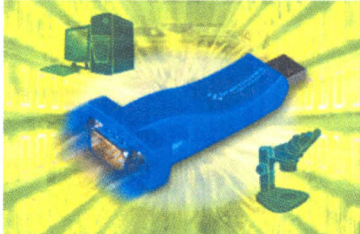
USB-zu-Seriell-Wandler mit RS-232- oder RS-422/485-Ports

Die ersten Geräte einer ganzen Serie sind jetzt bei PLUG-IN Electronic verfügbar: